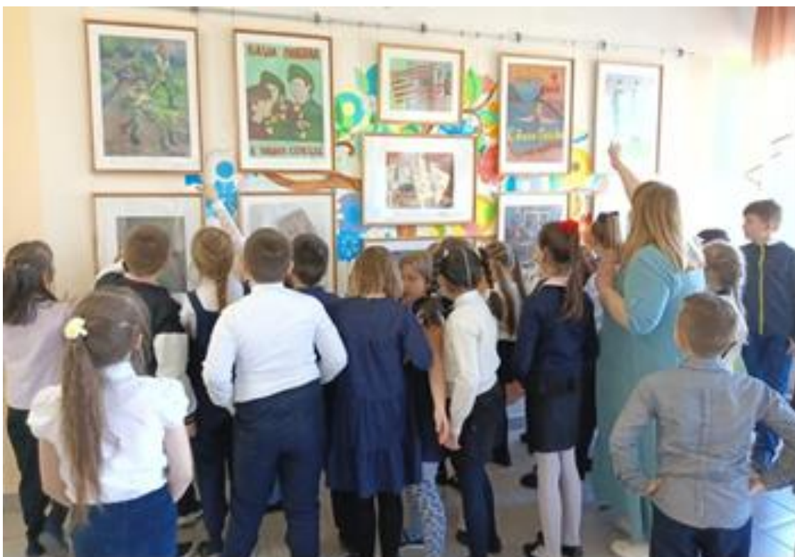
Передвижная выставка, посвященная 9 мая. МБОУСОШ № 2.

МБУК "Музейно-выставочный центр", г.о. Серпухов