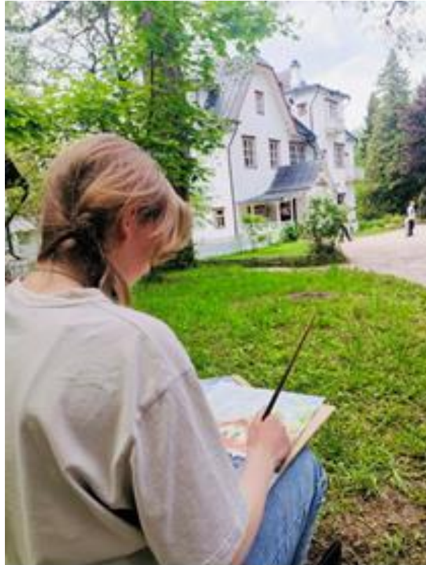
Экскурсия – пленэр в Государственный мемориальный историко-художественный и природный музей-заповедник Василия Дмитриевича