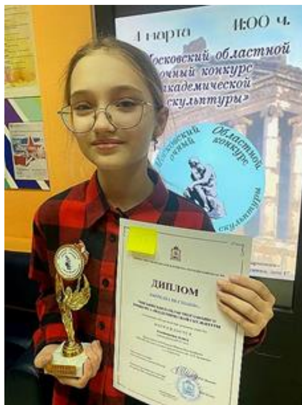
Московский областной очный конкурс академической скульптуры. МБУДО «ЦДШИ «Гармония» Наро-Фоминский г.о.