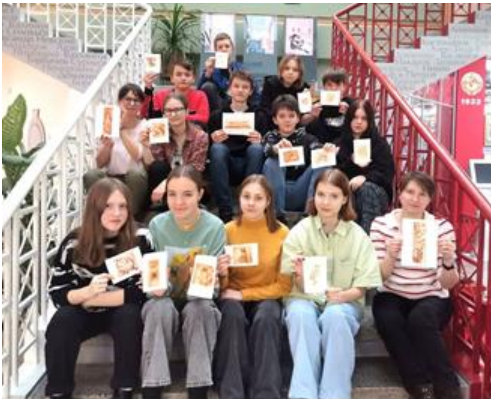
Мастер-класс по линогравюре с учащимися МБУДО ДХШ им. А. А. Бузовкина в