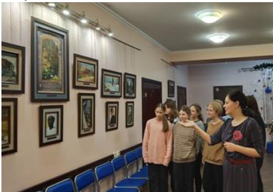
Выставка постеров «В.Д. Поленов и художники его круга» в МБУДО ДХШ им. А.А. Бузовкина.