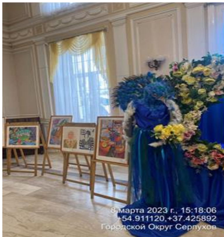
Выставка работ учащихся МБУДО ДХШ им. А.А. Бузовкина, посвященная весне. МАУК «Парки Серпухова». Парк. О. Степанова.