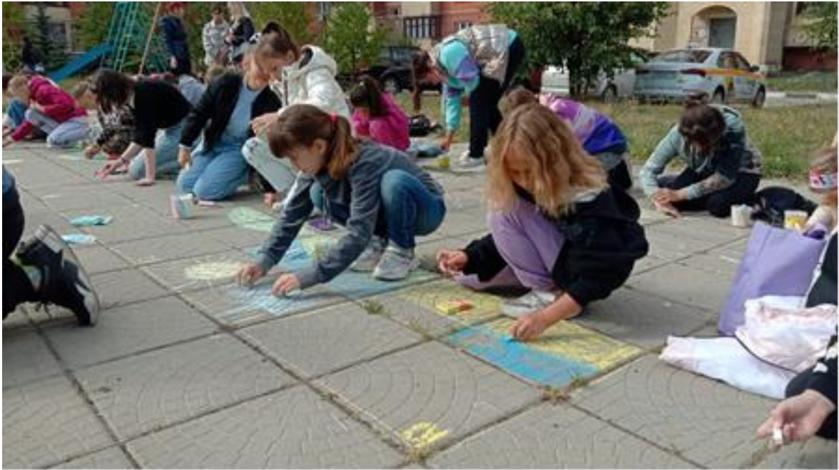
Конкурс рисунка на асфальте «Пусть всегда будет солнце!».