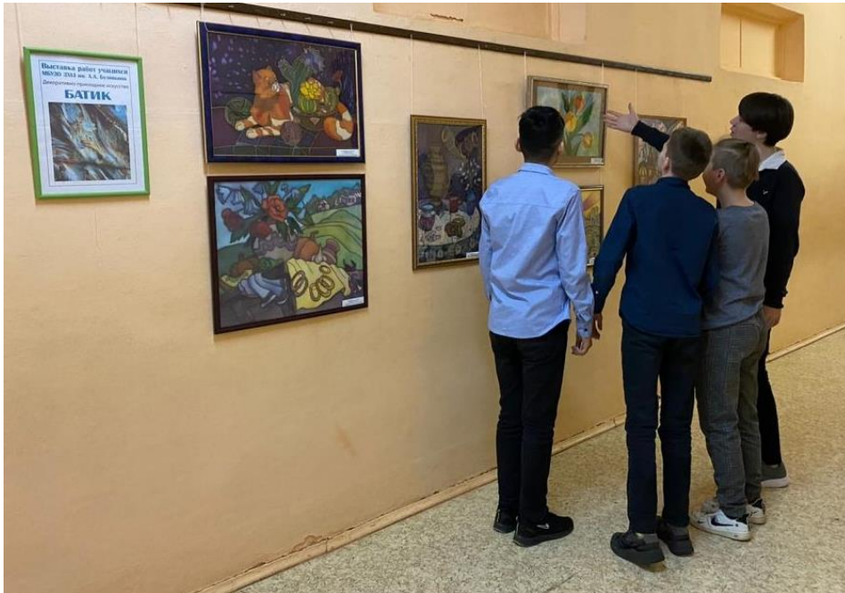
Передвижная выставка работ учащихся МБУДО ДХШ им. А.А. Бузовкина «Батик» в МБОУ СОШ №6.