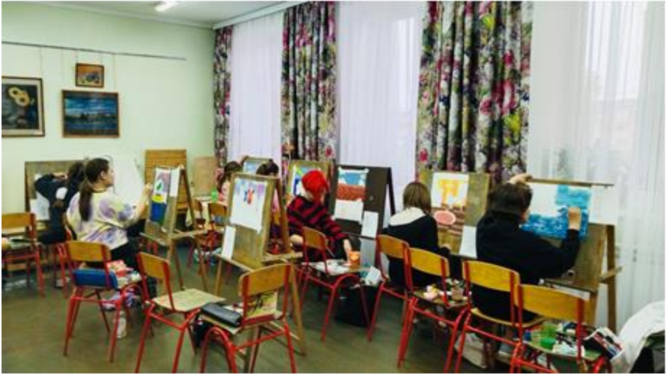
Вступительные экзамены в МБУДО ДХШ им. А.А. Бузовкина.