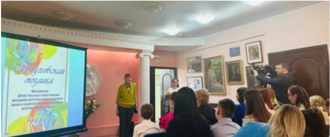
Московская областная выставка-конкурс «Серпуховская мозаика» МБУДО «Детская художественная школа им. А.А. Бузовкина», г.о. Серпухов.