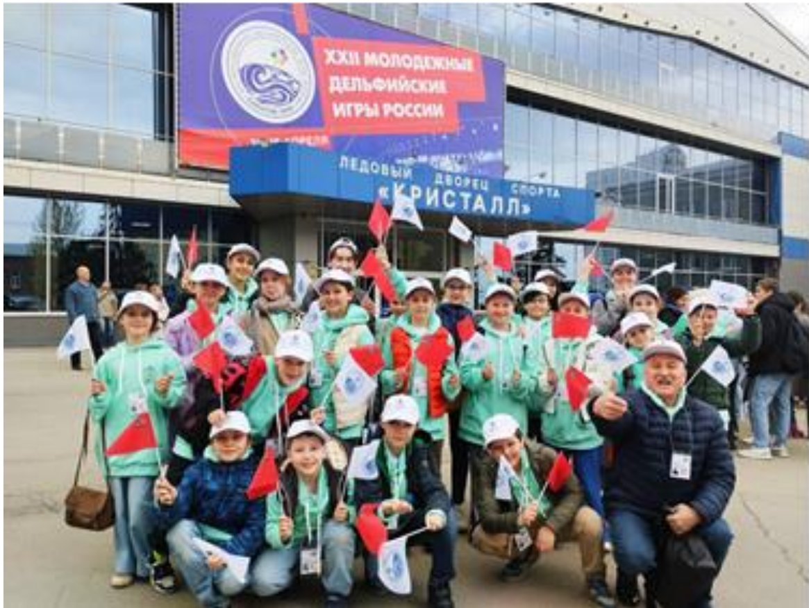
Участие в XXII молодежных Дельфийских играх России. г. Саратов