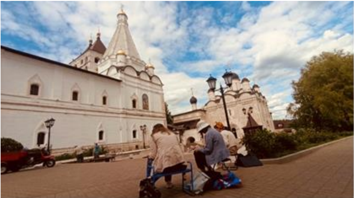
Пленэрная практика учащихся МБУДО ДХШ им. А.А. Бузовкина.