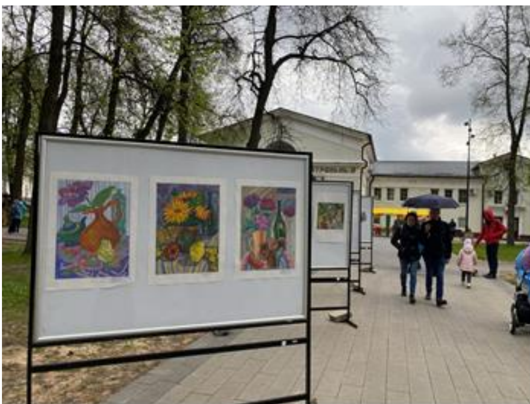
Выставка работ учащихся МБУДО ДХШ им. А.А. Бузовкина МАУК «Парки