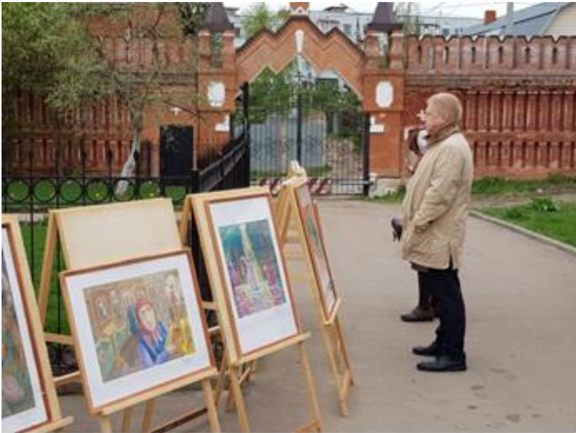
Передвижная выставка работ учащихся МБУДО ДХШ им. А.А. Бузовкина посвященная духовно- культурному фестивалю, приуроченному к православному празднику – Дню жен мироносиц. Введенский женский монастырь.