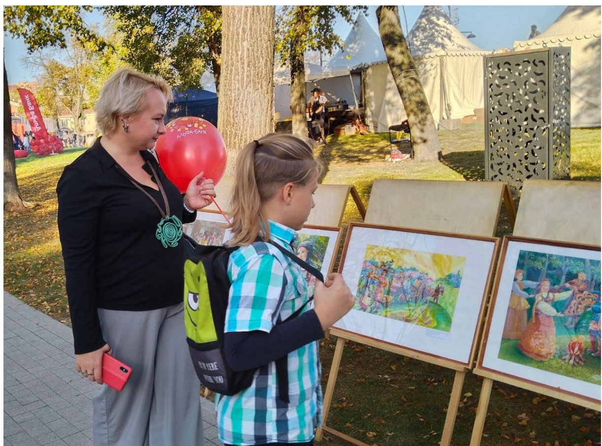
Мастер-классы и экскурсии для воспитанников ГБУ СО МО «Комплексный центр социального обслуживания и реабилитации «Серпуховский»