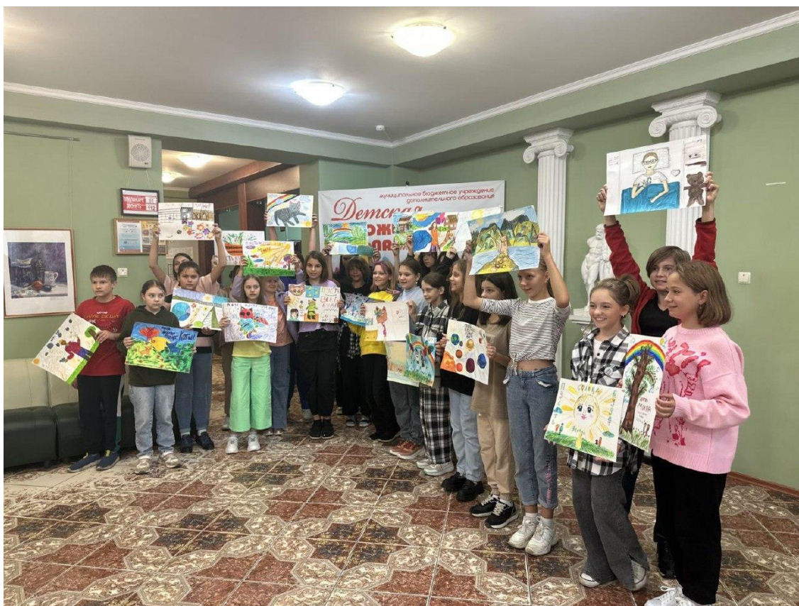
Выставка «Уроки изобразительного искусства» в рамках юбилея МБУДО ДХШ им. А.А. Бузовкина в «Музейно-выставочный центр».