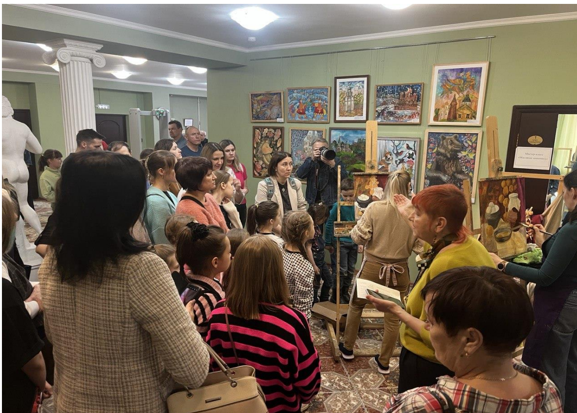
Экскурсия и мастер-класс по фотовыставке Центра фотоискусства имени Николая Андреева и Василия Улитина при Серпуховском отделении Союза журналистов. «Музейно-выставочный центр».