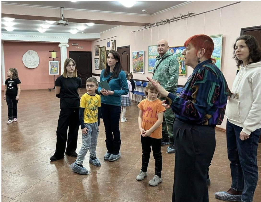
Мастер-классы, экскурсии МБОУ СОШ №17, МБОУ СОШ №7,