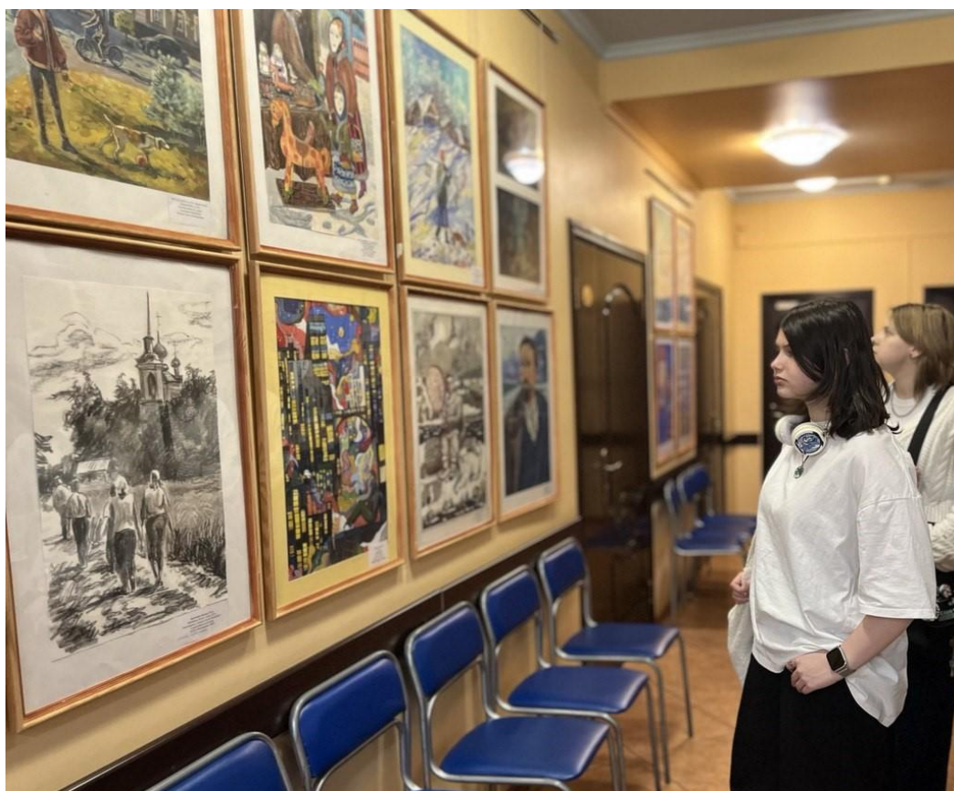
Уроки-экскурсии в рамках программы «Культура для школьников» в ГАУК МО «СИХМ» г.о. Серпухов.