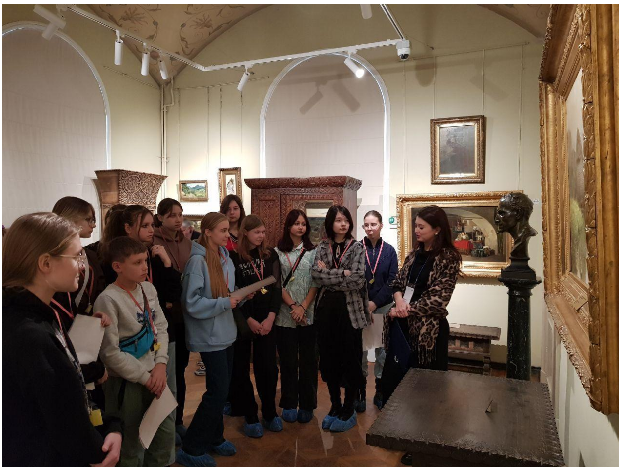
День открытых дверей в МБУДО ДХШ им. А.А. Бузовкина.