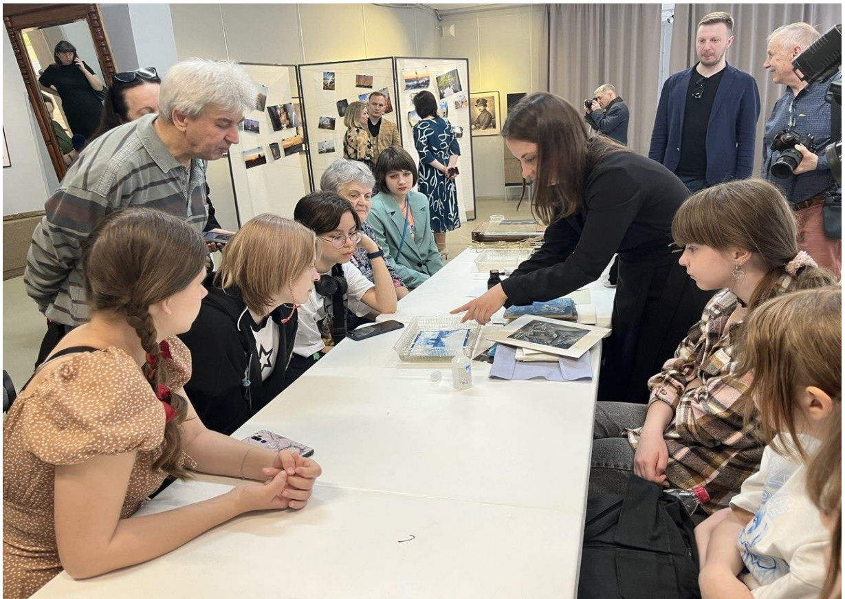
Урок-экскурсия и пленэрная практика в рамках проекта «Времена года» обучающихся МБУДО ДХШ им. А.А. Бузовкина в ФГБУ «Приокско-Террасный государственный заповедник».