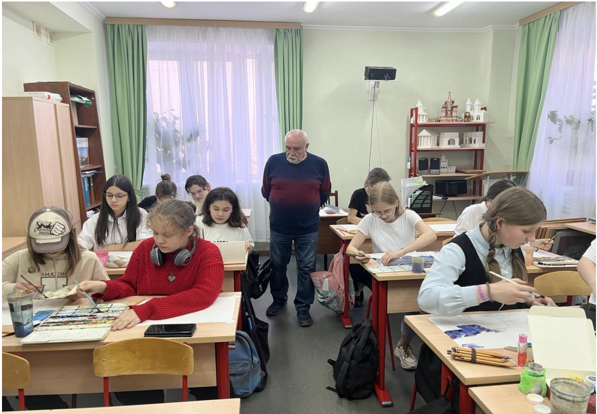
Мероприятие «Посвящение в юные художники». МБУДО ДХШ им. А.А. Бузовкина.