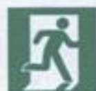
E 01-02 Выход здесь